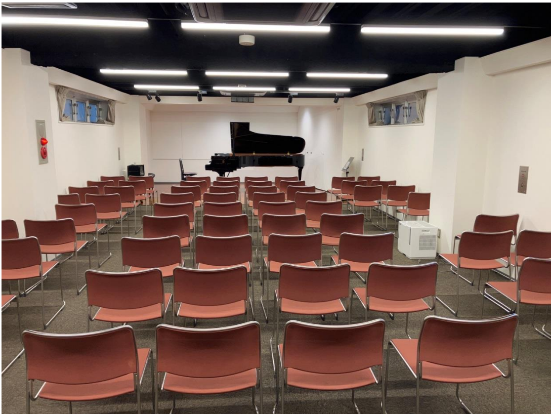
3F スタインウェイスタジオ