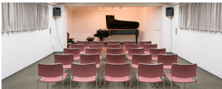
3F スタインウェイスタジオ